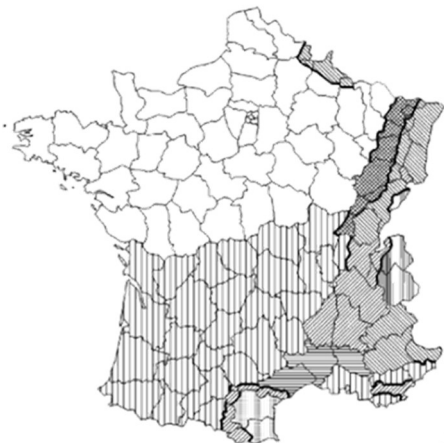
Charge exceptionnelle de neige